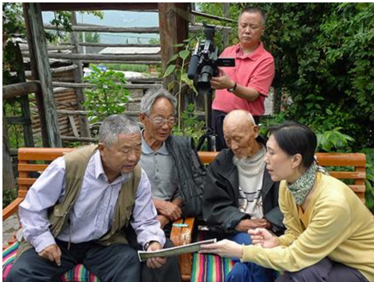
白枫拍摄记录东巴祭司释读英国东巴古籍藏本的过程

课题研究得到北京市社科联的支持和资助，目的是在国内外博物馆、图书馆等机构东巴经典藏品信息进行数字化获取的基础上，用音视频的数字化手段拍摄记录下老东巴祭司释读和吟诵东巴经典古籍的原始读音的全过程，将其读音与象形文字逐字逐句用形象对位起来，以影视人类学的视角剪接完成音视频资料短片，把抢救记录下来的这一“世界记忆遗产”资料留给学者们及后人作进一步的研究，从而达到对东巴经典古籍的传承。