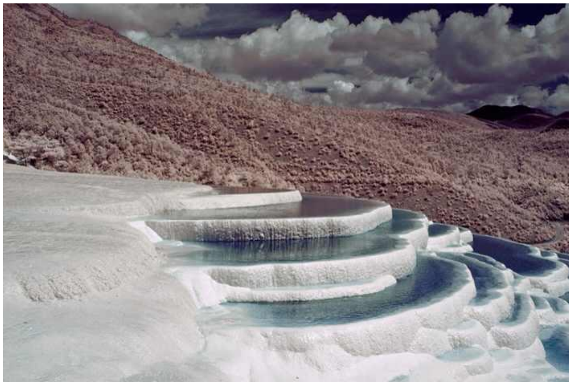
香格里拉白水台

白水台位于香格里拉县城东南三坝乡白地村，距县城 100 千米。北京东巴文化艺术发展促进会的志愿者们连续三年在这里进行东巴文化的抢救工作。